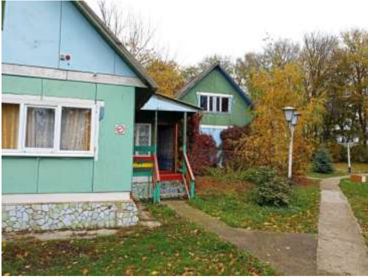
Фото №5 – Вход в жилой корпус