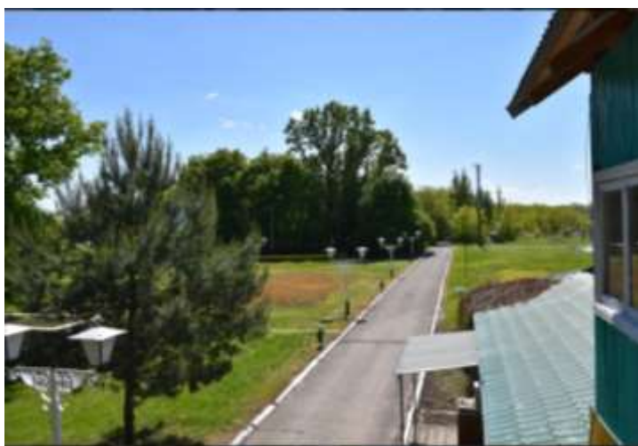
Фото №3 – Территория лагеря