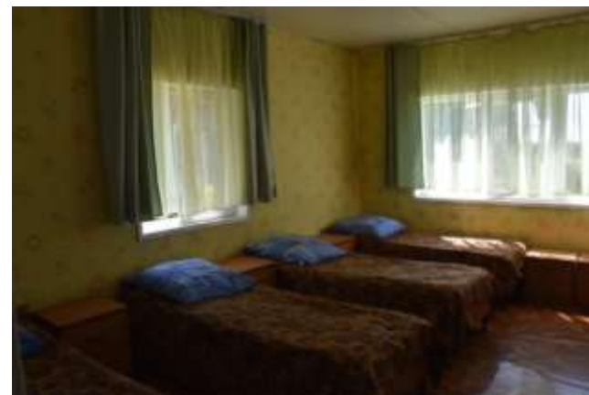
Фото №2– Жилой корпус