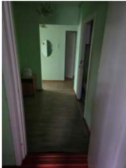
Фото №7 – Коридор в жилом корпусе №1