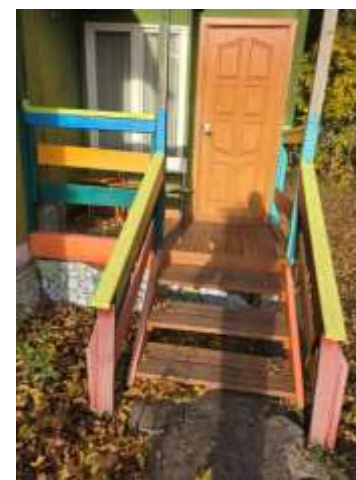
Фото №4– Вход в жилой корпус