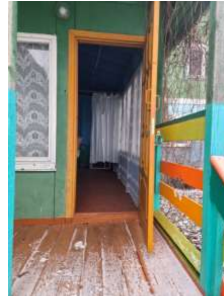
Фото №6– Вход в жилой корпус