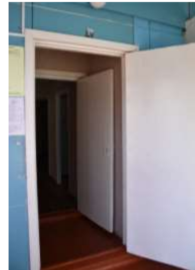
Фото №8 – Корпус №1